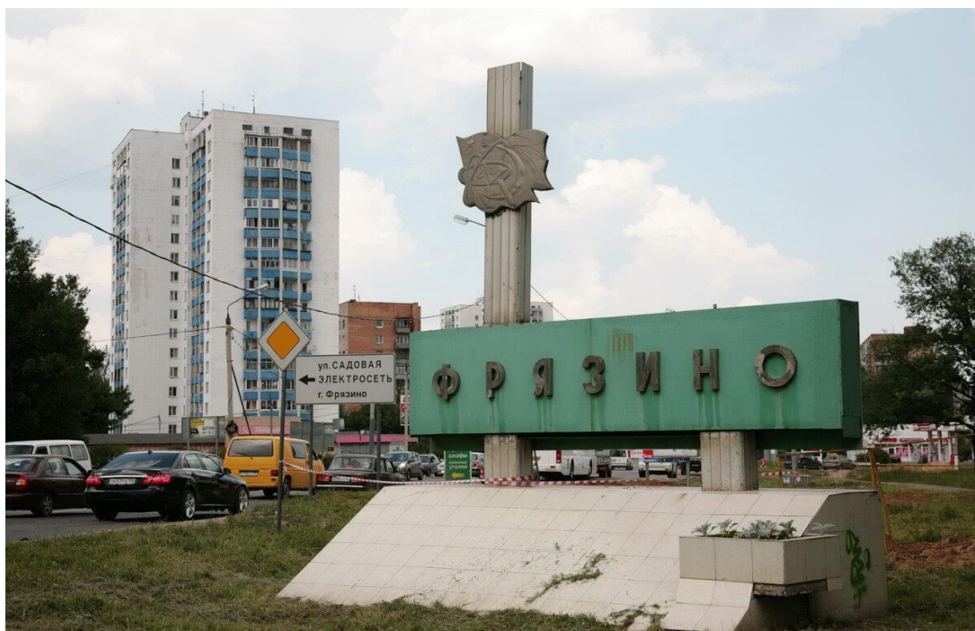
Наукоград Фрязино.

Говорят, за Пушкино, в буре снеговой, Бродят люди странные с пёсью головой. Ничего не сеют, ничего не жнут. Ну и пёс бы с ними. Я останусь тут.