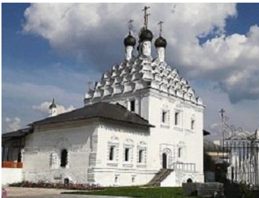
Храм Николы-на-Посадях, Коломенский Посад.