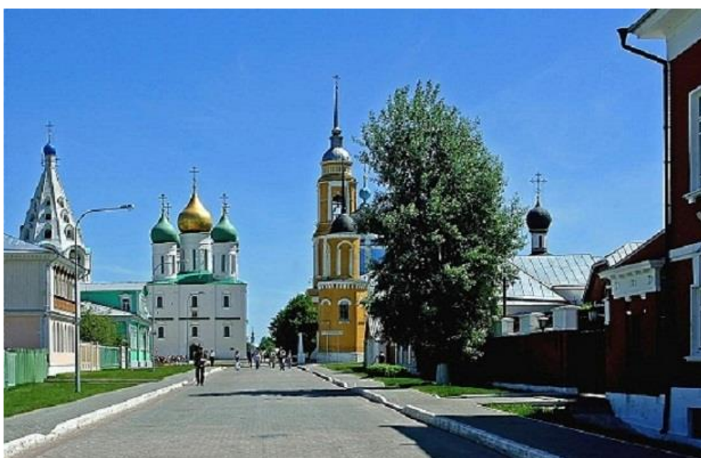
Коломенский кремль.

Глядит История в бойницы старых башен, с высоких стен старинного кремля.