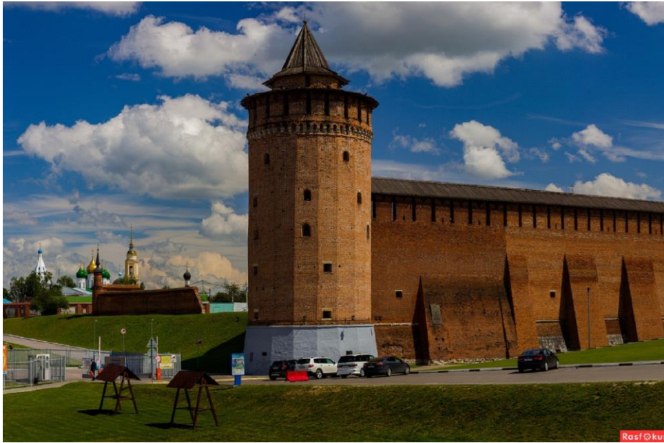
Маринкина башня, Коломенский кремль.